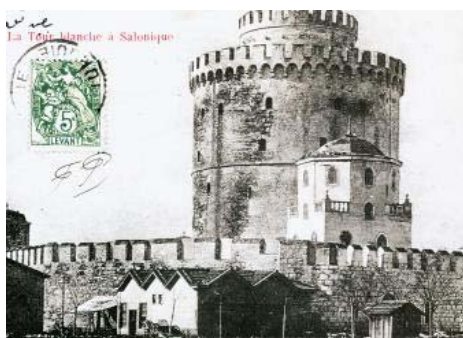
Ο Λευκός Πύργος με τα περιμετρικά του τείχη, όπως ήταν στα τέλη του 19ου αιώνα (1892)

Τον 2ο π.Χ. αιώνα πέρασε στη ρωμαϊκή κυριαρχία, όπως και ο υπόλοιπος ελλαδικός και μικρασιατικός ελληνιστικός χώρος, και απετέλεσε αρχικά μία από τις τέσσερις έδρες διοίκησης των επαρχιών της Μακεδονίας, ενώ αργότερα έγινε πρωτεύουσα ολόκληρου του ρωμαϊκού «θέματος» της Μακεδονίας. Στην απαρχή της μετάβασης από τη Ρωμαϊκή Αυτοκρατορία στη Χριστιανική Αυτοκρατορία της Ανατολής με