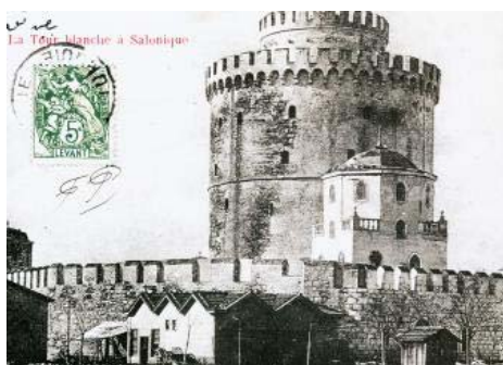
Ο Λευκός Πύργος με τα περιμετρικά του τείχη, όπως ήταν στα τέλη του 19ου αιώνα (1892)

Τον 2ο π.Χ. αιώνα πέρασε στη ρωμαϊκή κυριαρχία, όπως και ο υπόλοιπος ελλαδικός και μικρασιατικός ελληνιστικός χώρος, και απετέλεσε αρχικά μία από τις τέσσερις έδρες διοίκησης των επαρχιών της Μακεδονίας, ενώ αργότερα έγινε πρωτεύουσα ολόκληρου του ρωμαϊκού «θέματος» της Μακεδονίας. Στην απαρχή της μετάβασης από τη Ρωμαϊκή Αυτοκρατορία στη Χριστιανική Αυτοκρατορία της Ανατολής με